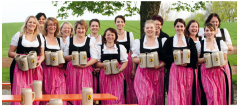
Wie aus dem Bilderbuch – unsere neuen Kellnerinnen. Ein Teil der charmanten Truppe stellt sich hier dem Fotografen!

Fesch, fröhlich und wild entschlossen: Die Volksfest-Mannschaft 2011 stellt sich vor